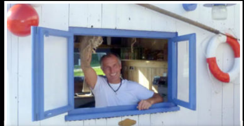
Pier 5 - die freche Snackbar